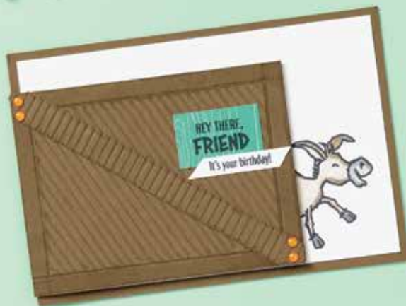
JK S. 144 FARBKARTON A4 IM SET Neutralfarben • 146999 11,00 € | £8.25