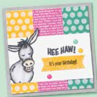
JK S. 143 FARBKARTON A4 O Flüsterweiß • 106549 11,75 € | £9.00