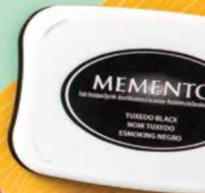
JK S. 147 MEMENTO™ STEMPELKISSEN 132708 7,50 € | £5.50