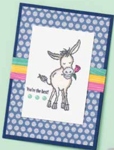
JK S. 158 LACK-AKZENTE IN COLOR™ 2020-2022 152480 9,75 € | £7.50